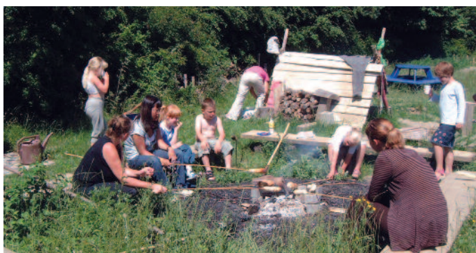
Bål giver stemning og atmosfære på legepladsen.

Det er de aktiviteter, der opstår her og nu med inspiration i det, børnene foretager sig på legepladsen, eller hvad personalet ser kunne være et godt input for en større eller mindre gruppe børn. Det kan være bevægelseslege, gå på opdagelse, synge og spille, finde dyr, bygge sandlandskaber, vandleg, bygge hule, kaste blade op i luften, historiefortælling mv.