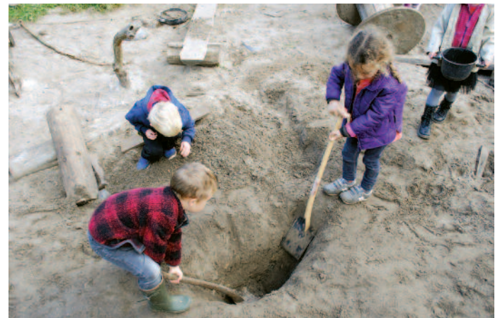
Et sandmiljø med kreative muligheder.

Design og anlæg af jeres eget legelandskab. Ring eller mail for et uforpligtende besøg