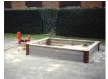
En traditionel sandkasse.

lege, konstruktionslege etc. frem for i éndimensionelle legesteder og legeredskaber. Hvis man for eksempel på en daginstitution når frem til, at det vil være en god idé, at børnene har mulighed for at lege med sand, så vil stedet blive langt mere interessant, hvis man vælger at lave et sandmiljø frem for en traditionel sandkasse.