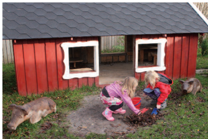
Legepladsen skal indeholde rum og materialer til børns rolleleg.

Det er vigtigt, at personalet prioriterer og værner om børnenes egen leg på legepladsen og ikke griber unødigt ind. Børn skal have tid til at lege, eksperimentere og undersøge verden i deres eget tempo. Et pædagogisk mål for legepladsen er at skabe gode fysiske rammer, der appellerer og understøtter børnenes egen legekultur.