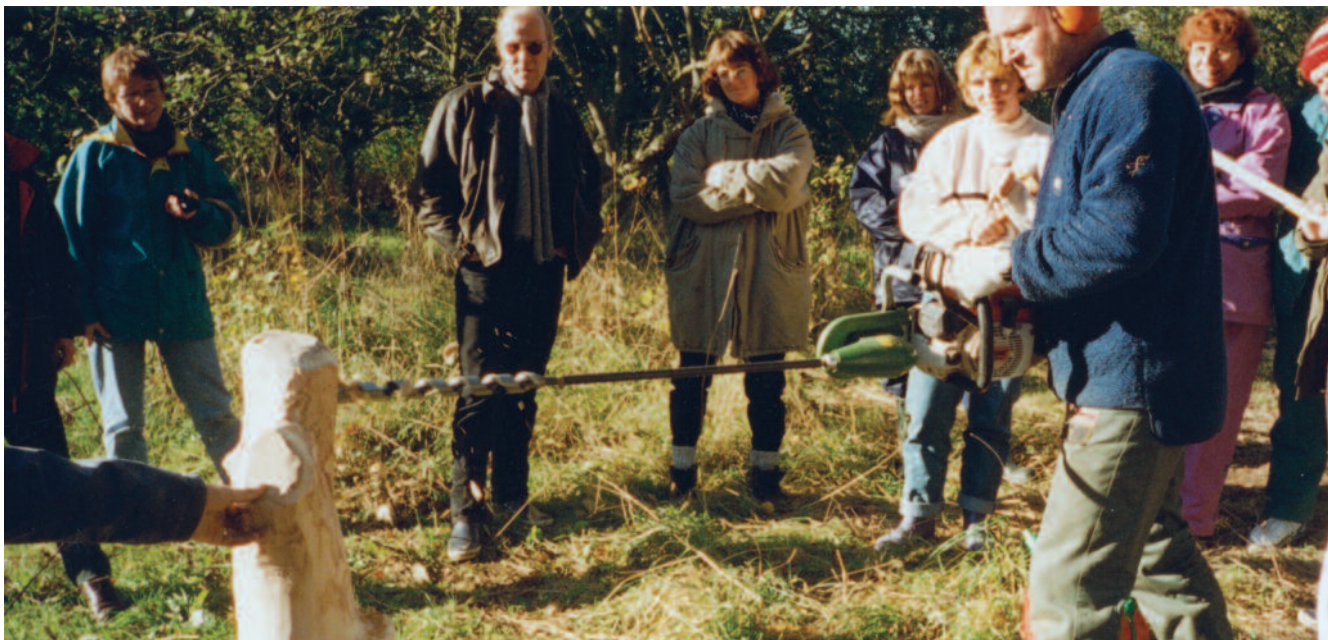
Workshop under en legepladskonference på Vejle Idrætshøjskole.

jøer. Samtidig afholdte Lejre-folket i DLS sædvanen tro deres velbesøgte lejrekurser. I 1994 udgav DLS en revideret folder om dyr på legepladser og institutioner, og i år 2000 udgav DLS i samarbejde med Frie Børnehaver og Fritidshjem en bog om bål og bålmad med titlen 'Skvalderkål og pandekager'. Det var også i 2000, at DLS fik produceret en plakat i forbindelse med DLS' opfordring til daginstitutioner, skoler m.v. om at afholde 'en huleuge' i hele landet.