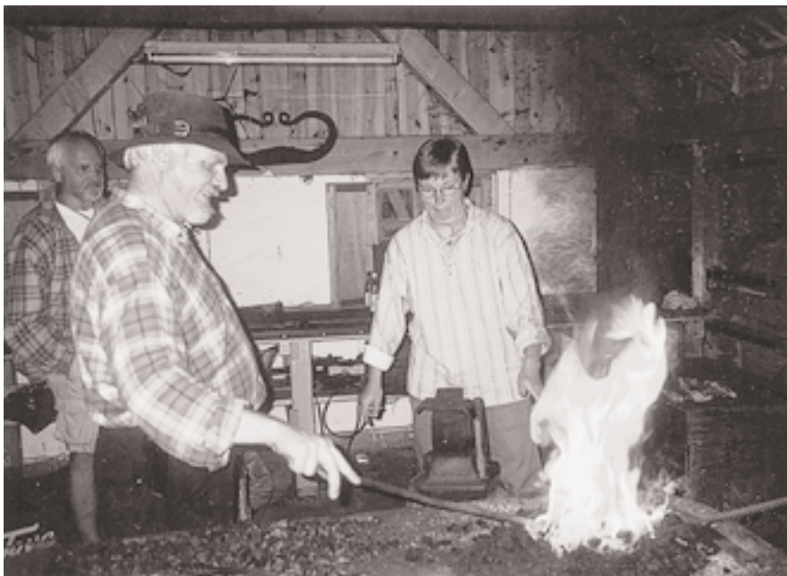
Aktivitet på et af Dansk Legeplads Selskabs Lejrekurser