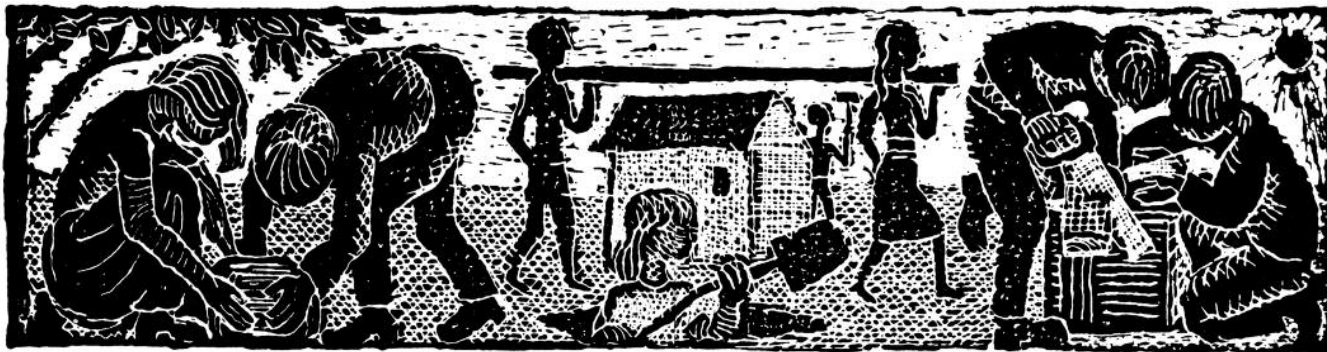
Vignet, som i mange år prægede Dansk Legeplads Selskabs publikationer og brevpapir. Tegnet af Ib Spang Olsen